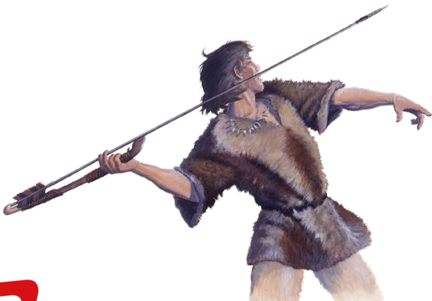
Peinture Gilles Tosello