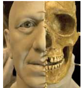
À demi os-terre, 2005 5000 ans BP – d'après le moulage du crâne « Der Warburger », Warburg, Allemagne