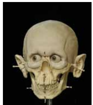
L'homme du Cerny, 2011 Vers 4300 avant J.-C. - d'après le moulage du crâne de la sépulture 7. Nécropole de Balloy « Les Réaudins » (Seine-et-Marne) Crédit : Photographe E. Daynès – Reconstruction : Atelier Daynès Paris