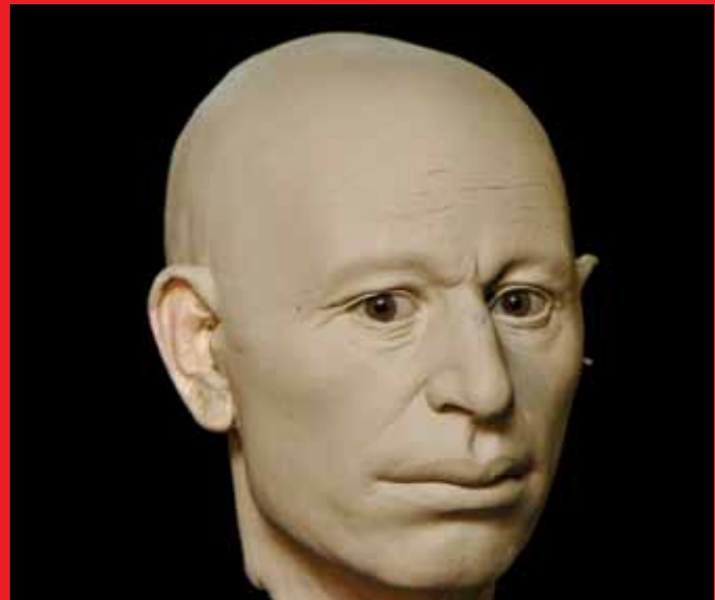
L'homme du Cerny, 2011 Vers 4300 avant J.-C. - d'après le moulage du crâne de la sépulture 7. Nécropole de Balloy « Les Réaudins » (Seine-et-Marne) Crédit : Photographe E. Daynès – Reconstruction : Atelier Daynès Paris