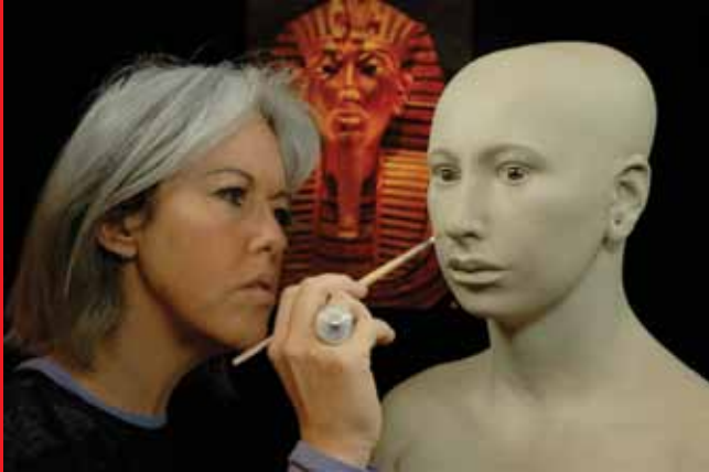
King Tut, 2005 3 300 BP d'après le scanner de la momie de Toutânkhamon - Égypte