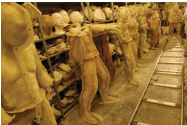
Couloir, 2005 Réserve de moules et plâtre à l'atelier Daynès Reconstruction : Atelier Daynès Paris