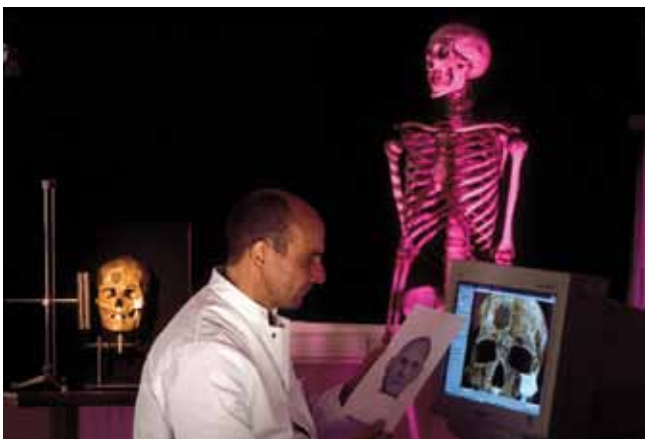
Étude anthropologique du crâne Cro-Magnon 1 par le Dr. Jean-Noël Vignal.