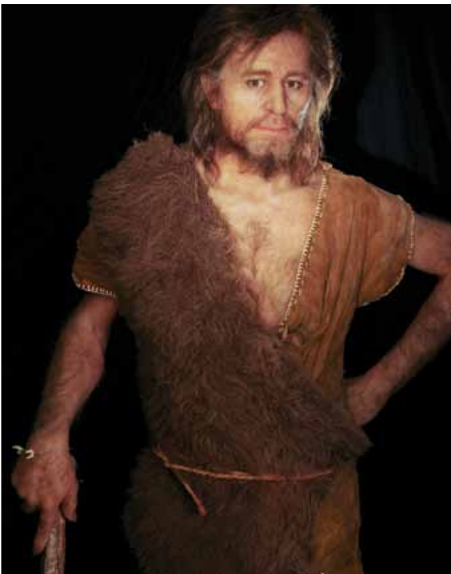
L'homme du Cerny, 2011 Vers 4300 avant J.-C. - d'après le moulage du crâne de la sépulture 7. Nécropole de Balloy « Les Réaudins » (Seine-et-Marne) Crédit : Photographe E. Daynès – Reconstruction : Atelier Daynès Paris

L'homme du Cerny était-il un agriculteur ? Nous ne le savons pas. Néanmoins, l'activité qui caractérise sans ambiguïté l'économie de cette période et de notre région est bel et bien l'agriculture. Le parti pris de remise en contexte historique de cet homme du Néolithique est donc de le représenter appuyé sur une hache, outil servant par excellence au défrichage de la forêt primaire pour la mise en culture des champs ou pour la création de pâtures. Enfin, la présence de haches dans plusieurs tombes du groupe de Cerny atteste que cette population accordait à cet objet une signification suffisamment forte pour qu'il accompagne le sommeil éternel de certains membres de la communauté.