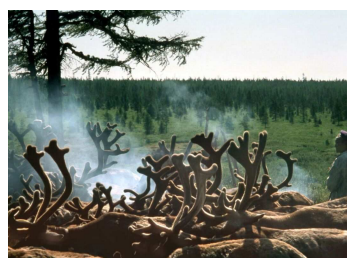
2. Troupeau de rennes protégé des moustiques par des fumées. Sud Yakoutie, Sibérie. Photo Alexandra Lavrillier, 1998.