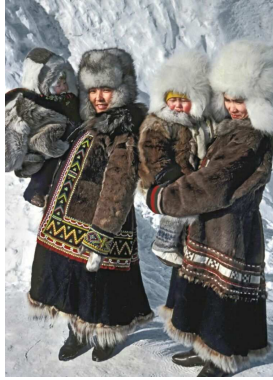
7. Costumes de traditions dolgane et nganassane. Taïmyr, Nord de la Sibérie. Photo Ethno Renne, 1996.