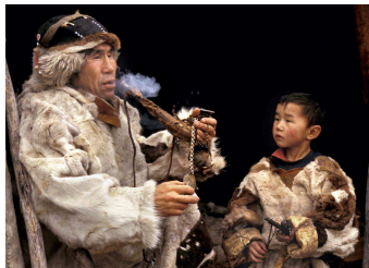
9. Les deux grands-pères : le jeune garçon est la réincarnation de son grand-père. Nord Kamtchatka, Sibérie orientale. Photo Ethno Renne, 1998.