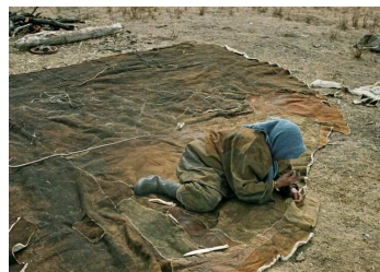
6. Réparation d'un couverture de yaranga. Nord Kamtchatka, Sibérie orientale. Photo Ethno Renne, 2000.