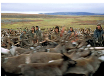
1. Capture des rennes. Tchoukotka, Sibérie orientale, Photo Virginie Vaté, 1997.

Liste des visuels disponibles par e-mail