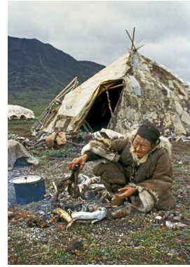
8. Préparation de sabots de renne grillés. Tchoukotka, Sibérie orientale. Photo Virginie Vaté, 1999.