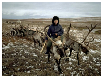
4. Dolganes traversant la toundra. Taïmyr, Nord de la Sibérie. Photo Ethno Renne, 1995.