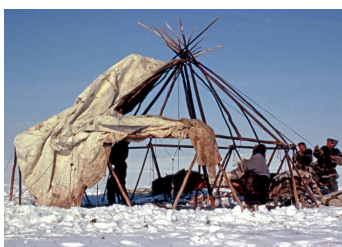
5. Installation d'une yaranga. Tchoukotka, Sibérie orientale. Photo Virginie Vaté, 1999.