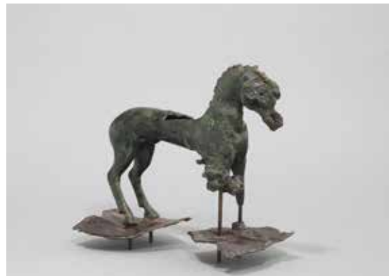
Cheval en bronze. Guerchy, « les Créchaumes » (Yonne)