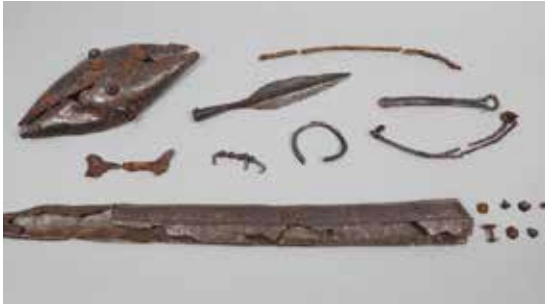
Armes et parures en fer retrouvées dans une sépulture. Saint-Benoît-sur-Seine, « la Perrières » (Aube), sép. 8