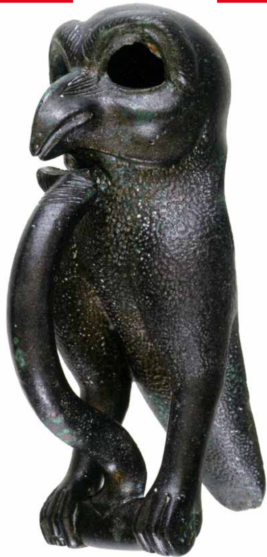
Rapace en bronze. Batilly-en-Gâtinais, « les Pierrières » (Loiret)