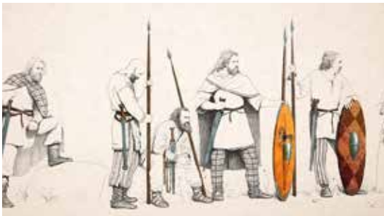
Restitutions de guerriers des IV e et III e siècles avant J.-C. © Jose Cabrera