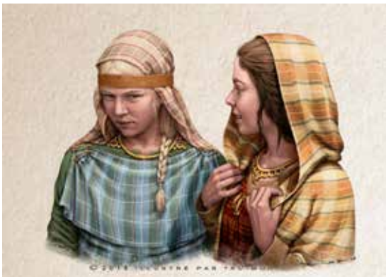
Portrait de deux femmes portant respectivement un torque ternaire (à gauche) et un torque à arceaux (à droite).