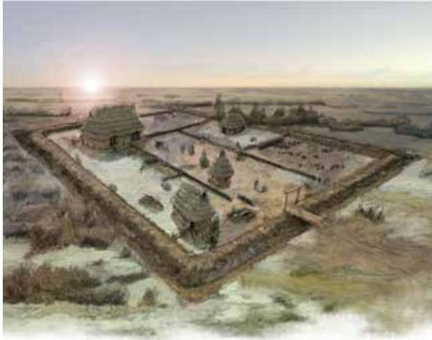
Plan et restitution de la ferme de Bazoche-lès-Bray, « la Voie Neuve » (Seine-et-Marne) © F. Reuille